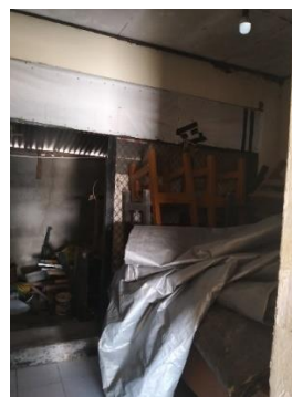
Gambar 1 Kondisi UKS SDN 32 AMPENAN

Sebelum memulai program ini, mahasiswa asistensi mengajar 3 meakukan diskusi bersama kepada sekolah dan dewan guru terkait untuk mengetahui permasalahan utama sehingga UKS tidak berfungsi sebaaimana mestinya. Dari hasil diskusi mendapatkan data bahwa selama ini dialihkan menjadi gudang penyimpanan barang bekas dan ruangan yang sudah cukup tua. Hal tersebut dikarenakan tidak ada staff khusus untuk mengurus UKS. Hal tersebut di dukung oleh hasil observasi yang dilakukan bahwa keadaan dan kondisi lingkungan UKS tidak layak untuk digunakan. Kondisi UKS di SDN 32 Ampenan sebelum dilakukan Unit Kesehatan Kelas dapat dilihat pada Gambar 1.