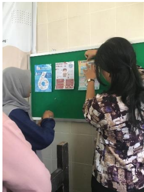
Gambar 2 Pemasangan Poster Kesehatan di tiap kelas

asistensi mengajar 3 mulai membuat papan penanda unit kesehatan kelas, membuat poster kesehatan, memasang kotak P3K, memabahkan obat-obatan, serta mendekorasi Unit Kesehatan Kelas. Kegiatan pelasanakan ditunjukkan pada gambar 2.