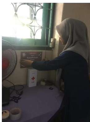
Gambar 3 Pemasangan Kotak P3K ditiap kelas

Berdasarkan gambar diatas, UKS di SD Negeri 32 Ampenan yang sedang dalam proses pembangunan ulang, maka UKS akan dialihfungsikan menjadi Unit Kesehatan Kelas yang akan diadakan pada tiap kelasnya seperti pada gambar 3.