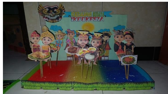
Gambar 2. Media Diorama

Setelah semuanya selesai, setiap kelompok diminta untuk maju mempresentasikan hasilnya. Setelah presentasi, peneliti melakukan survei kepada peserta didik dan memberikan soal evaluasi. Pada kegiatan penutup, peneliti bertanya kepada setiap siswa apa saja yang mereka dapatkan dari pembelajaran hari ini. Kemudian, siswa dipersilahkan untuk bertanya tentang hal-hal yang kurang dipahami, dan bersama-sama melakukan refleksi serta peneliti memberikan pesan moral agar peserta didik terus belajar. Setelah itu, berdo'a bersama dan pulang.