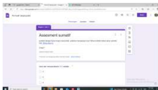
Gambar. 2 Tampilan Pertanyaan