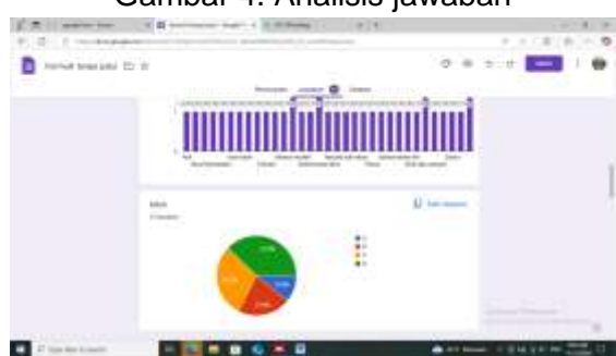
Gambar 4. Analisis jawaban