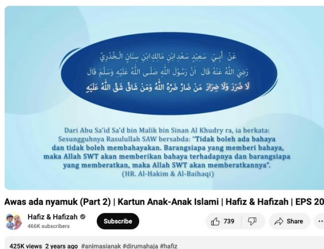
Gambar 3. Konten Pada Kanal Youtube Hafiz dan Hafizah

Hadits ini juga disebut dalam Sunan Ibn Majah (2340) dan (2341) Sunan Al-Darqutni (3/77) dan juga Al-Muwatta (2/745). Lafal hadits: "Siapa yang mendatangkan kemudharatan, Allah akan mendatangkan kemudharatan kepadanya. Dan siapa yang menyulitkan, Allah akan menyulitkannya." Abu Umar berkata mengenai lafaz "tidak ada kemudharatan dan tidak ada membahayakan": Ada beberapa pendapat. Salah satunya adalah bahwa kedua kata ini adalah sinonim dan diucapkan secara bersamaan sebagai bentuk penegasan. Ada juga yang berpendapat bahwa keduanya memiliki arti berbeda, yaitu "tidak boleh seseorang mendatangkan kemudharatan kepada orang lain, dan jika ada kemudharatan yang datang, maka hendaknya bersabar." Al-Khushani menjelaskan bahwa "kemudharatan" adalah sesuatu yang menguntungkan bagimu tetapi merugikan tetangga, sedangkan "membahayakan" adalah sesuatu yang tidak menguntungkan bagimu dan juga merugikan tetangga.