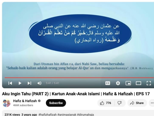
Gambar 2. Konten Pada Kanal Youtube Hafiz dan Hafizah