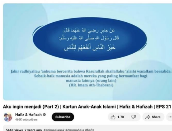
Gambar 4. Konten Pada Kanal Youtube Hafiz dan Hafizah